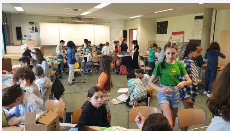
Ponts de l'amitié en 3D créés par les CM2 B et les 5e2 lors d'une séance commune d'arts plastiques