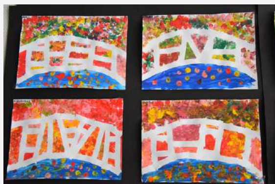
Extraits de l'exposition lors de la Fête de l'école

Mme Labutin, guide à Francfort, est venue présenter l'histoire et l'architecture des ponts de la ville à des classes d'élémentaire. L'intérêt de construire des ponts pour développer les échanges, le commerce, pour unir et réunir les pays, les régions, les familles... a stimulé l'imagination des CP, entre autres. Un beau voyage à travers les époques et les continents !