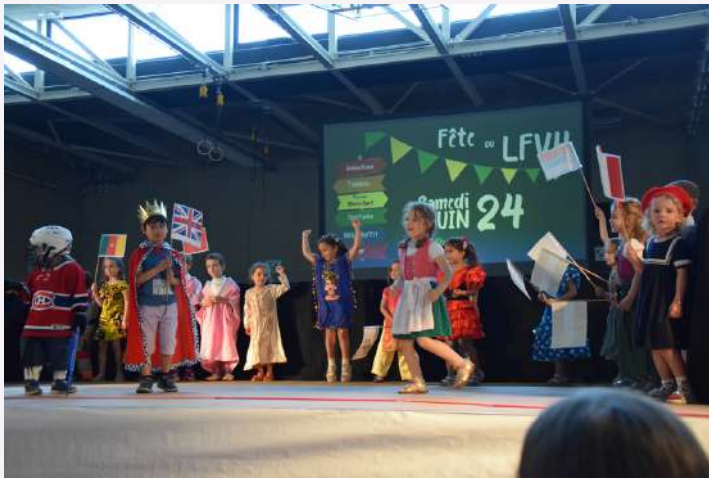
Défilé du monde par les mS B