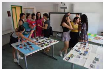
Réactions en chaîne avec les 4e, expo Abibac et photos du voyage en Angleterre des 5e