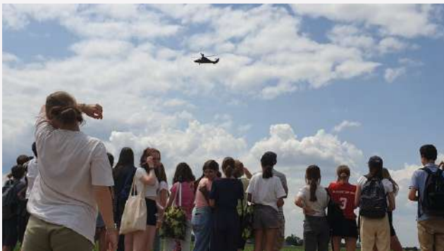
Découverte des métiers de la sécurité lors du Hessentag par les 4e section internationale