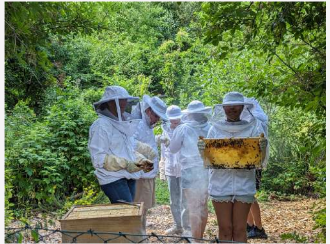
Initiation à l'apiculture au "Bienenlehrpfad" du Niddapark pour les 6e avec leurs professeurs d'E.I.S.T.