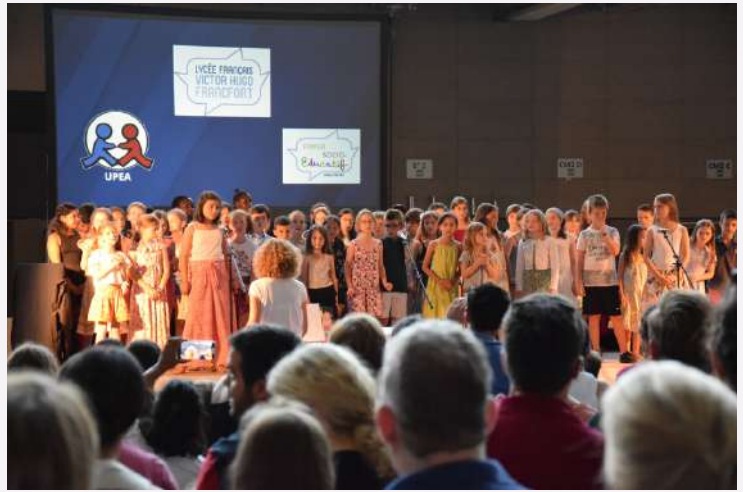
Chorale du primaire

Quelques clichés souvenirs de ce traditionnel moment de la fin de l'année. Merci d'être venus aussi nombreux ! Merci aux parents et enfants bénévoles, merci à l'UPEA, merci à Mme Appel, trésorière du FSE, merci aux enseignants et personnels d'avoir permis cette réussite !