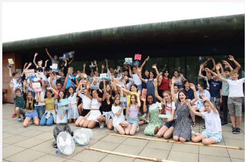
Tests grandeur nature sur la terrasse du lycée des chars à voile fabriqués en groupe par tous les 5e dans le cadre de leur initiation à la technologie en EIST.