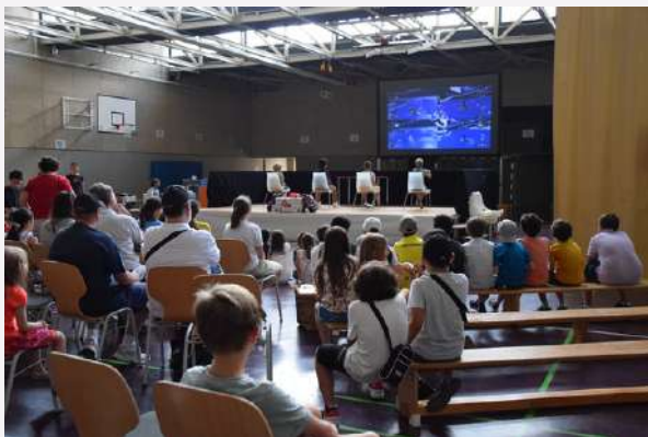
Finale du tournoi Mario Kart- collège