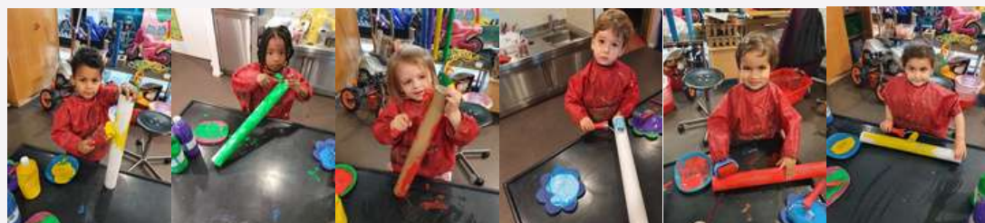
Des élèves de PS A (Mmes Fischer et Sadick) lors de la fabrication de leur pont suspendu... dans le hall de la maternelle