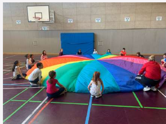
Début mai la fédération de football de Hesse a animé des séances de sport et motricité avec les CE1 B !