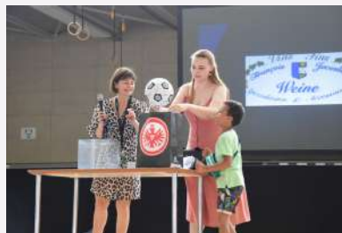
Un fan de l'Eintracht très heureux d'avoir gagné le gros lot de la tombola