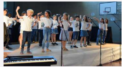
Les CE1 d en pleine danse !