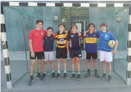
Participation d'élèves au 1er "Trikottag" du Land de Hesse le 14 juin pour mettre en avant les associations et clubs sportifs