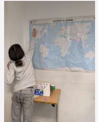
L'histoire-géo par le jeu