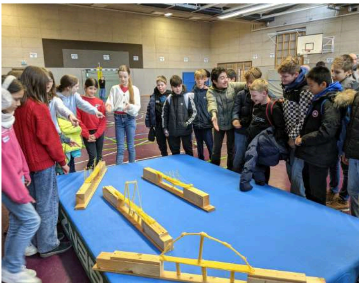
La journée franco-allemande, un pont entre les élèves