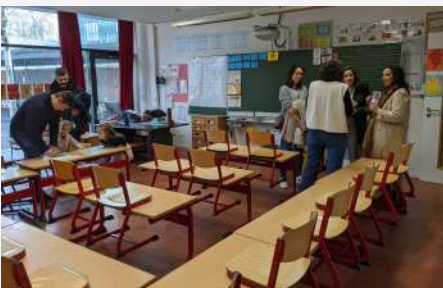
Plein d'infos sur l'élémentaire