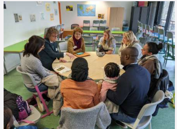
Rencontre avec la Direction