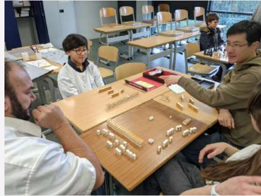
À la découverte du chinois