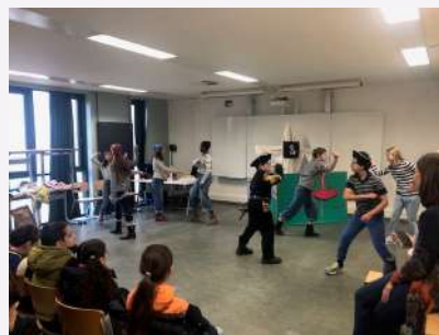
Comédie musicale en anglais