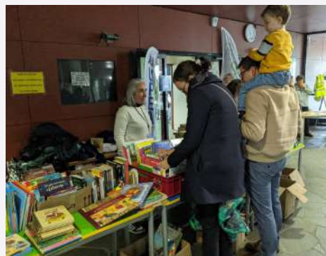
Braderie de livres de l'UPEA