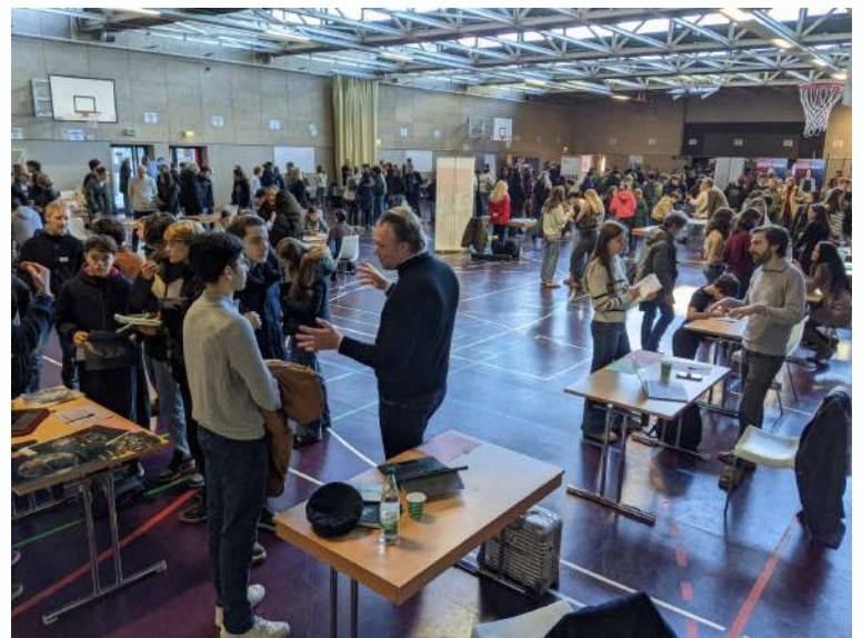
Le carrefour des métiers, l'orientation au cœur du lycée