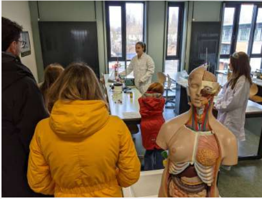
En classe de sciences