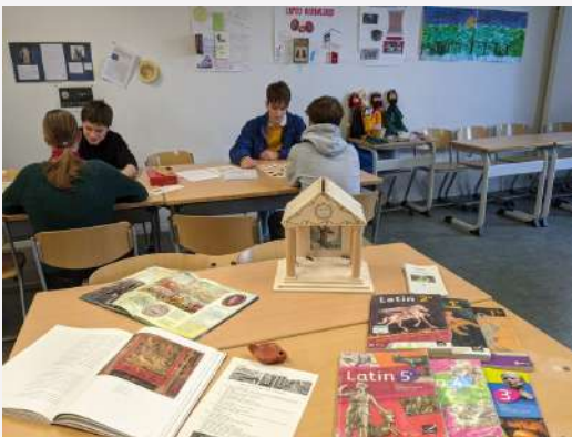
En classe de latin