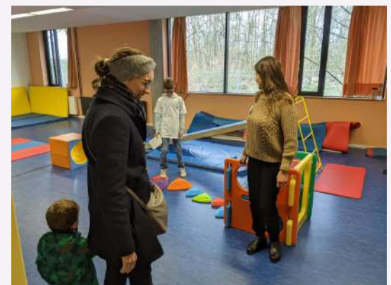
La salle de motricité de la maternelle