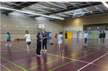
Jeux et tournois au gymnase