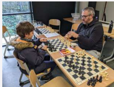
Espagnol et échecs