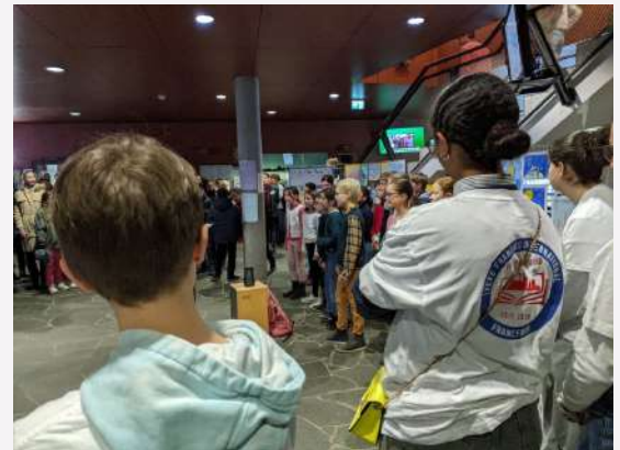
Chorale à l'accueil