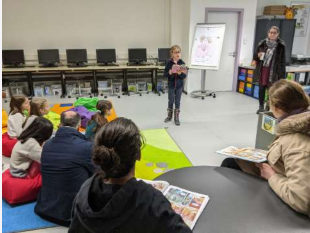
À la BCD, les Petits champions de la lecture

Un immense merci à tous les participants, élèves, personnel, partenaires... pour votre énergie et votre engagement collectif !