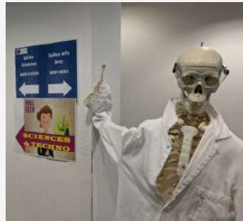
... ainsi que l'indispensable squelette !