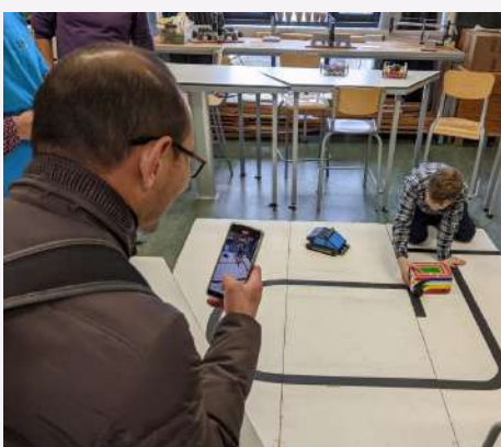
Découverte de la robotique