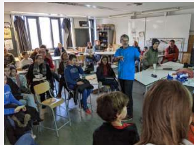
Le club jardin