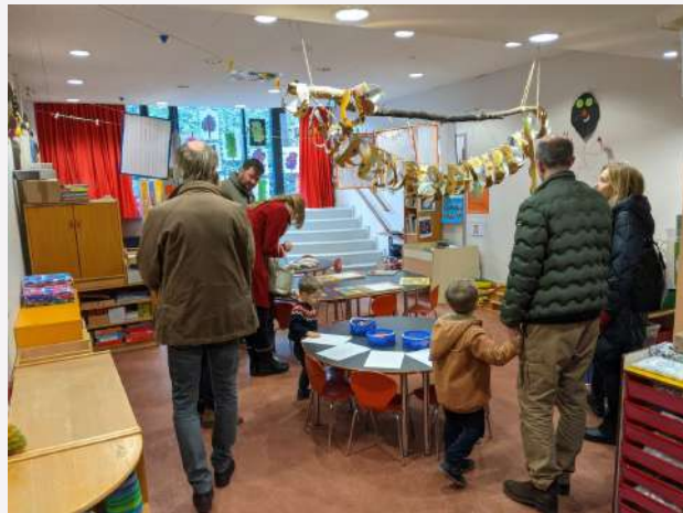
La maternelle « à la française »