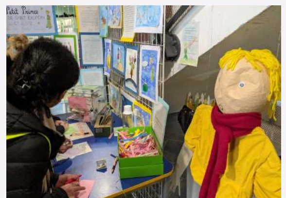
Le Petit prince accueille les visiteurs