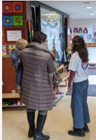
Des élèves pour guider les visiteurs...